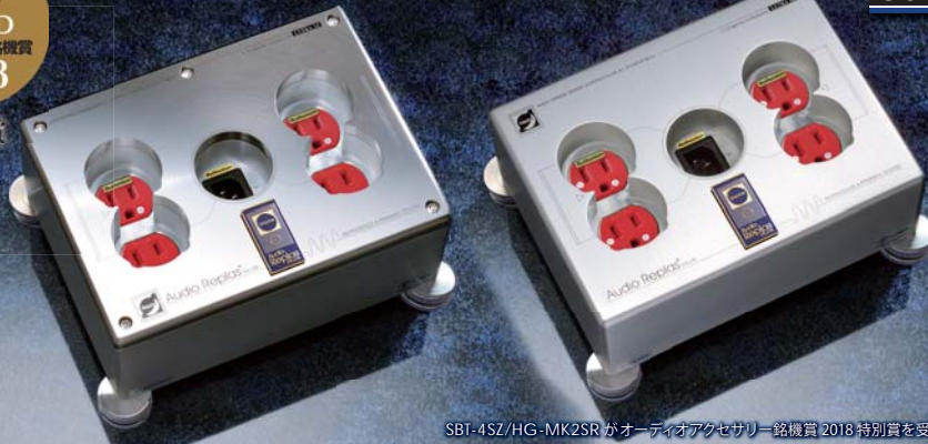
SBT-4SZ/HG-MK2SR がオーディオアクセサリー銘賞2018特別賞を受賞