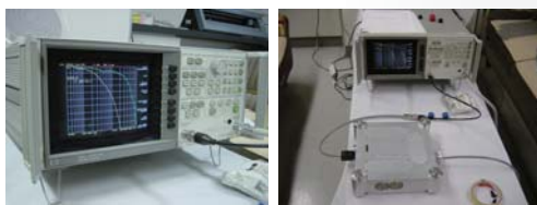
▲HP社 Network Analyzer 高周波基準ノイズ信号をインレットからタップに入力し、コンセントから出力されたノイズ信号を測定。タップを通すことでノイズがどれだけ減衰するかを測定。

なぜなら、オーディオ機器を動作させているエネルギーはすべてコンセントの AC100V から来ているもので、そこには送電される際に非常に多くのノイズが混入してきます。もちろんノイズでも低い周波数のものは耳に聞こえてしまうノイズも稀にありますが、音質に非常に大きく影響しているのが「高周波ノイズ」です。