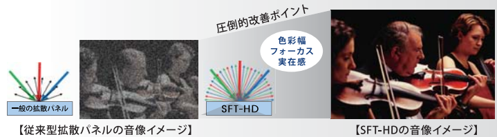
【従来型拡散パネルの音像イメージ】