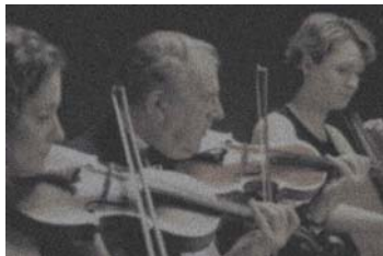
【従来型拡散パネルの音像イメージ】