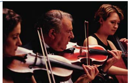
【新SFC-HDの音像イメージ】