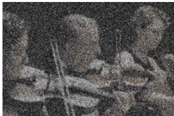
【従来型拡散パネルの音像イメージ】